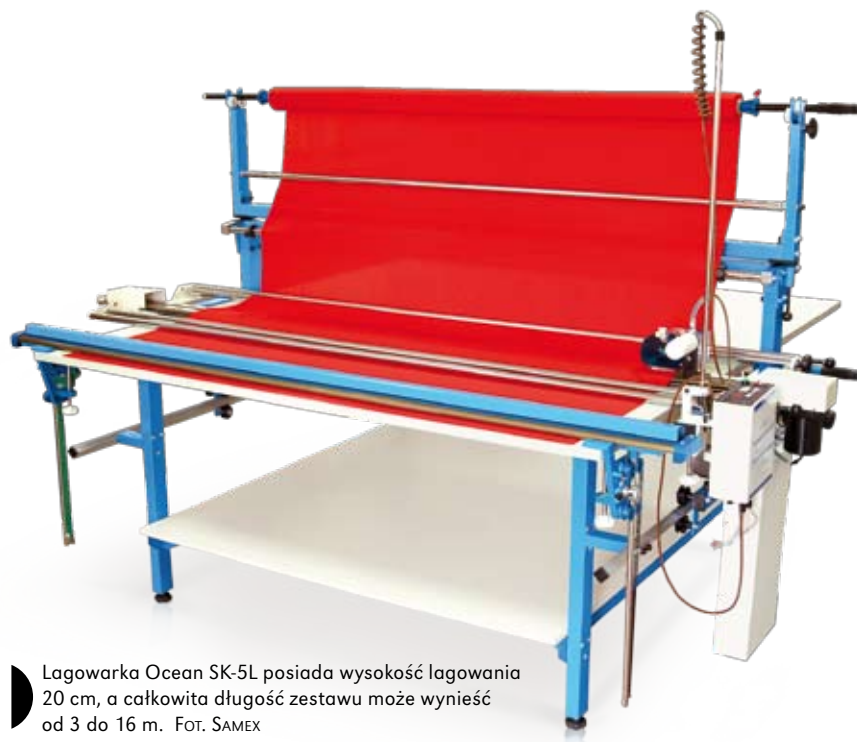
Lagowarka Ocean SK-5L posiada wysokość lagowania 20 cm, a całkowita długość zestawu może wynieść od 3 do 16 m.

Lagowarka Ocean SK-5L to urządzenie, które charakteryzuje stabilność pracy, lekkość i wytrzymałość konstrukcji oraz precyzja wykonania. Poza tym celem jego producenta – firmy Samex – było stworzenie narzędzia, które będzie służyło tak samo dobrze przez wiele lat, nie wymagając napraw, regulacji, czy wymiany elementów.